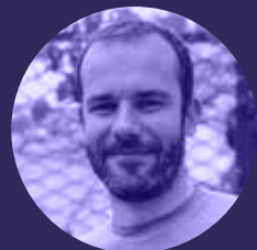
Dalibor Ménage et entretien